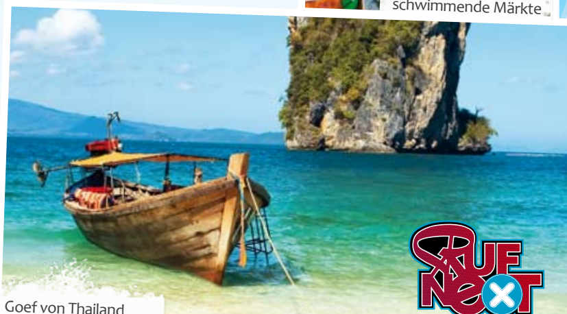
Goef von Thailand