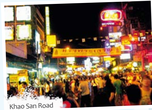
Khao San Road

BANGKOK SURATTHANI KO SAMUI KO TAO BAN SAIREE CHUMPHOM